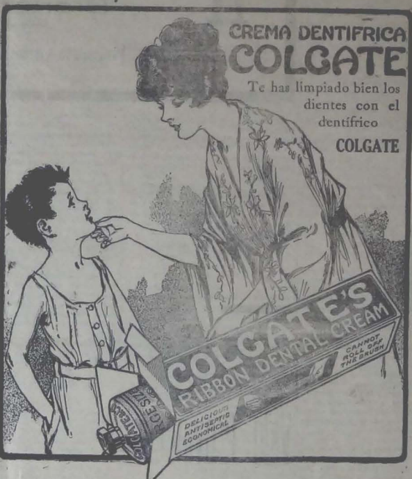
Para que su fisonomía sea completa, necesita tener buena dentadura. Use para esto la PASTA DENTAL de Colgate & Compañía.