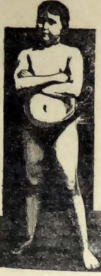
EDAD 11 AÑOS

La transformación, maravillosa de un sér enérjico y raquítico en un adolescente fuerte, robusto y sano, como lo demuestra su atlética figura, fué obra realizada por la