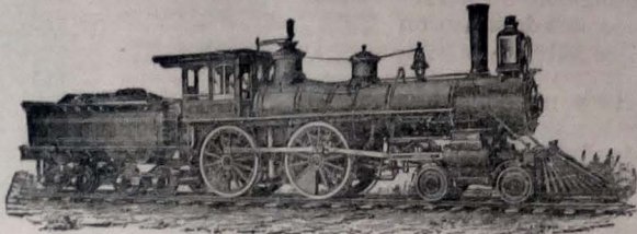
Calidad superior, precios fijos, baratos y al contado

TRASTOR DE ALUMINIO NIQUELADO: Ollas, sartenes, sopetas, platos, vasos, embudos, tucetes, cucharones, azucareras, etc., etc. COCINAS DE FIERRO, completas. Tornos de hierro estañado para leche. LINTERAS Y FAROLES para el campo y la ciudad. ARAÑAS, JARDINERAS Y PASALES. CAMAS DE FIERRO, metal y niqueladas, un nuevo surtido de bonitos modelos. SILLAS Y MEBAS plegadivas. TRASTOS DE HIERRO ENLOZADO, DEGRADO: Teteras, lecheras, calderas, jarras y lavavajaras, portavajaras, baldes con tapas, juegos para té y café. MOLDRES PARA GALLETAS, gelatinas, pasteles y mantquilla. CUADROS con lindas molduras, un surtido variado. JUEGOS DE VASOS para CERVEZA. CENTROS DE MESA. OMOGRAFIAS FINAS. MOLDURAS DORADAS Y PLATEADAS.