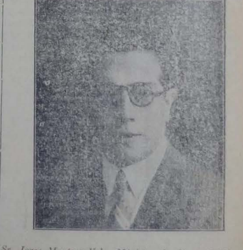
Sr. Jorge Montero Vela, Ministro de Obras Públicas