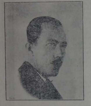
Sr. Alberto Ordoñana C., Ministro de Gobierno

El programa mínimo, según el cual, debe ser mayor, cualquiera que cualquier otro ciudadano no ha de atender ni contarlo, sino en contra el espíritu de la ley. NARE sostendrá y defenderá siempre a la soberanía e integridad nacionales. Los Partidos Políticos: El grupo NARE considera de necesidad los diversos partidos políticos y se esforzará por crear ambientes propicio a la libre organización y desarrollo de ellos. Descartalización: NARE por razones de justicia y para desarrollar y fortalecer los pueblos, pequeños o grandes, evitará la absorción por parte del Estado, trabajará por una descentralización gradual y progresiva. Colonización y riego: NARE trabajará activamente para que se dé preferencia, en el estudio de obras públicas, al riego de las zonas más necesitadas de él en la República. Es preciso atender ante todo a la tierra, la gran fuente de nuestra riqueza. Se establecerá la colonización nacional, civil y militar. La civil se hará de preferencia con elemento indígena y obrero, atendiendo al Estado a la previsión de la extensión y el progreso de la agricultura.