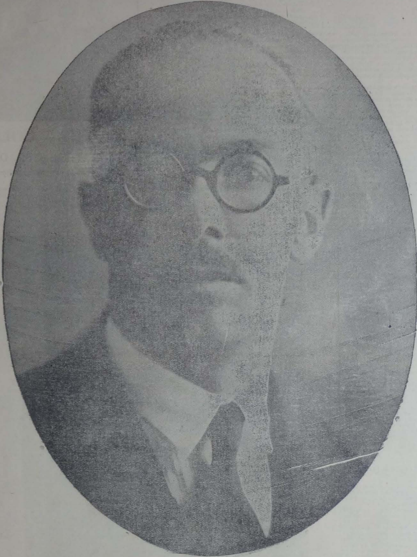
Dr. José María Velasco Ibarra, Presidente Constitucional 1934-1938

En 1928 publicó su primer libro «Estudios varios». Colección a r t f e l o s ya salidos a la luz, y sobre diversos temas, en especial sobre política, política y jurídicas. Más de trescientas páginas. El libro le dio fama. Pero le consagró definitivamente como escritor el libro «Democracia y constitucionalismo», que publicó en el siguiente. Es obra profunda, definitiva y sorprendente a lo que reza el título. Esta obra consagró al mismo tiempo y sobre todo como pensador profundo y poderoso filósofo, pensaba observador y por lo tanto buen sociólogo. Inmediatamente publicó en los volúmenes (1930) una