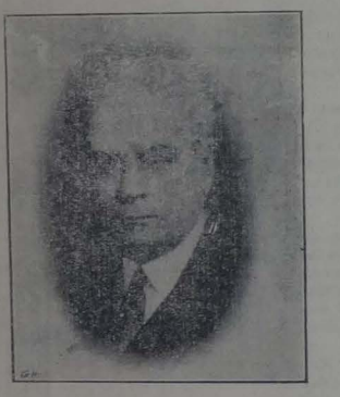
Sr. Atanasio Zaldumbide, Ministro de Guerra