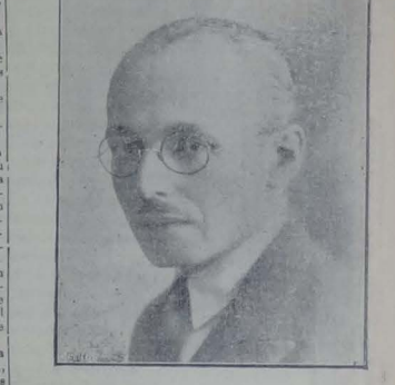
Sr. Manuel Sotomayor y Luna, Ministro de RR. EE