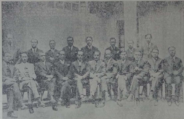
Los Presidentes de los Comités Vflasquistas de esta capital, a cuya sesión decidida y fervorosa se debe, en mucho, el triunfo alcanzado en este lugar, en cuanto se relaciona a la exaltación al Solio Presidencial del eminente hombre público, señor doctor don José María Velasco Ibarra.

El sistema unicameral con representación política, funcional y técnica. NARE quiere que el control a la situación se haga en forma de una ley de brevedad posible, tomando en cuenta la necesidad económica y que se haga en justicia lo que se debe al Es- tado para su desenvolvimiento futuro.