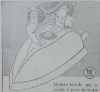
Modelo ideado por la mujer y para la mujer

VENDO hermoso lote de terreno entre las ciudadelas "Pichincha" e "Isabel la Católica" Mide 40.000 metros cuadrados Pormenor: Loja 92 Teléfono 3-51 VIII-12-IX-12