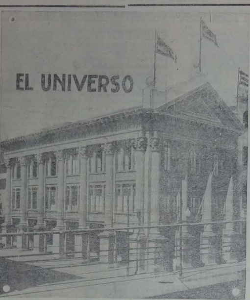
EDIFICIO MAGESTUOSO DE "EL UNIVERSO"

Que quidán vibrando en vuestros oídos las siguientes pala-bras de Luis López de Mesa: La liberación económica, la liberación ideológica, pas por