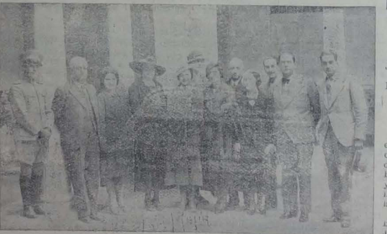
Personal de la Embajada enviada por la República de Colombia a la trasmisión del Mando del Doctor José María Velasco Ibarra

Artículo 1º.- Aceptábase dichas renuncias, dejando constancia del agradecimiento del Gobierno por los servicios prestados con patriotismo en el desempeño de sus cargos por los expresados señores. Artículo 2º.- Nómbrase para Ministros de Estado en las Carteras de Gobierno y Previsión Social, Relaciones Exteriores, Educación, Tangarabala, Ibarra, General Córdova, la artillería Targui, el Cuerpo de Sanidad, la Cruz Roja Militar y por último el secundario de caballería Yagacuti. La revista resultó de lo más grandioso. Todo su excepción constituyó un espectáculo digno de ser recordado como interminables patmosos y vivas.