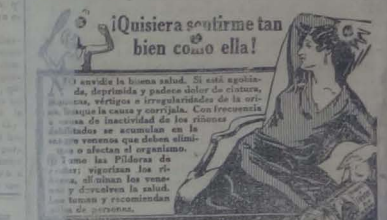
¡Quisiera sentirme tan bien como ella!

1.- Conjunto de sésen en lame ado. Comprende un traje con faldas ligeros y un abrigo y una chaqueta de corte tallado con mangas amovibles. Es el ejal de la elegancia de un nivel superior. 2.- El gualtino modelo ejecutado en faldas azul violada. Es de líneas muy sencillas. La brillantez del tejido del mismo género, que al volar deslucido forma una gran armonía decorativa. 3.- Ideal para jóvenes en este primer trabajo de román azul claro ostenta en los bordes volantes pliegados y dispuestos en forma de cascadas, descubriendo parte del brazo. Realizado en forma cubriendo la parte alta del brazo y descubriendo atrás hasta llegar al codo. Ligeo tipo de metal.