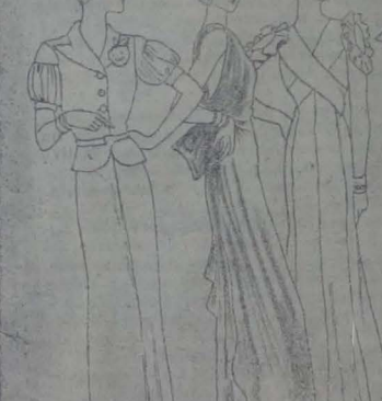
Un momento de la vida doméstica.

1.- Conjunto de sésen en lame ado. Comprende un traje con faldas ligeros y un abrigo y una chaqueta de corte tallado con mangas amovibles. Es el ejal de la elegancia de un nivel superior. 2.- El gualtino modelo ejecutado en faldas azul violada. Es de líneas muy sencillas. La brillantez del tejido del mismo género, que al volar deslucido forma una gran armonía decorativa. 3.- Ideal para jóvenes en este primer trabajo de román azul claro ostenta en los bordes volantes pliegados y dispuestos en forma de cascadas, descubriendo parte del brazo. Realizado en forma cubriendo la parte alta del brazo y descubriendo atrás hasta llegar al codo. Ligeo tipo de metal.