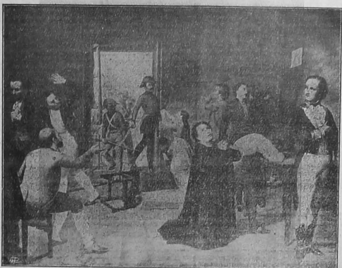
ASESINATO DE LOS PATRIOTAS. EL 2 DE AGOSTO DE 1810.

El sol de tus dominios y grandeza se puso al fin, y el sol de la esperanza,