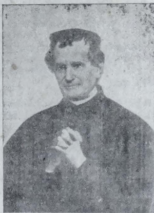
El Venerable Don Bosco

Ahora, para restablecerla, no nos queda otro remedio que volver a acogernos a nuestra Constitución, exigiendo que todos la respeten; ahora, como patriotas conscientes, debemos constituirnos todos, todos, en guardianes de la libertad política del Ecuador, consignada y guardada, como el último y único tesoro de nuestra independencia legada por los próceres, en la ánfora de la Constitución. Ciertamente es una Constitución defectuosa y obra del sectarismo liberal; pero al fin es el único amparo que le queda al pueblo contra las tiranías y despotismos de nuestra turbulenta democracia, es, como ya lo expresamos, la única salvación en el naufragio.