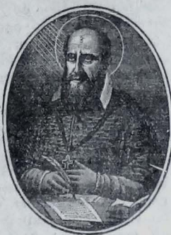
San Francisco de Sales

Al conocer éstos, que no pasarán de simples decires, no hemos podido menos de reírnos, pues que nos parece imposible que una Corporación tan seria como la integrada por los militares italianos, se vaya del Ecuador porque un cualquiera que se da de escritor la insulte o la denigre. Esto no es creíble ni puede pasar entre gente sensata; de modo que, saliendo por los fueros de los italianos que nos favorecen, podemos asegurar al público ecuatoriano que no es ni puede ser cierto que la Mi-