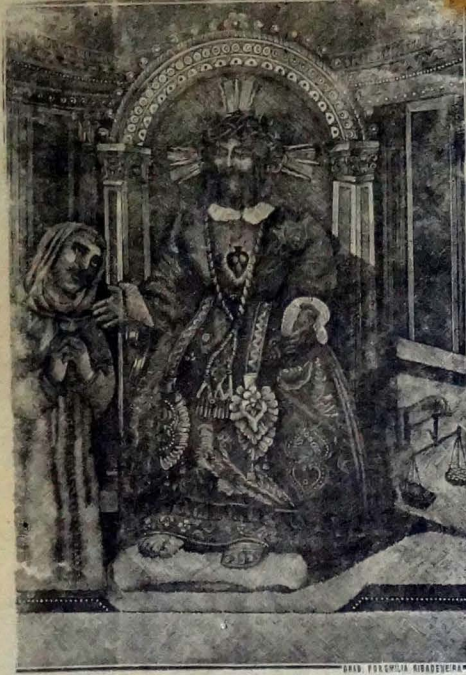
EL SEÑOR DE LA BUENA ESPERANZA O DE LA PORTERÍA