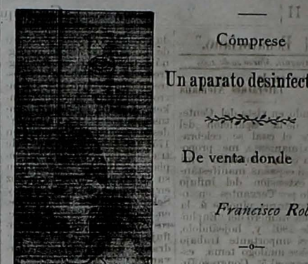
Un aparato desinfectante