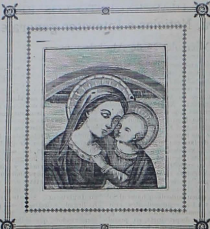
Nuestra Señora del Buen Consejo (1)

Con motivo de celebrarse hoy el 48 aniversario de la maravillosa aparición de Nuestra Señora del Buen Consejo, en el venturoso pueblo de Genazzano (Italia), queremos trazar estas breves líneas en honor de tan gloriosa Madre, y en obsequio de sus numerosos devotos.